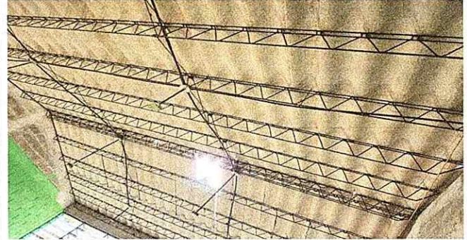
Foto 2: Estructura y cubierta de Lamina en mal estado, con filtracion de agua en el aula