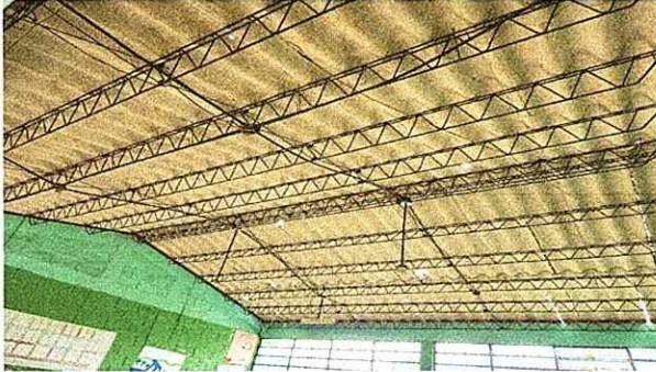
Foto 1: Enlaminado de duralita, peligro para los alumnos en las aulas